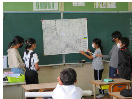
<いぶすきふるさと学>

10月8日(土)に本年度も北指宿中学校と南指宿中学校の1年生と本校の6年生が総合的な学習の時間に交流をしました。小中交流学习では「いぶすき学」でお互いに調べたことを壁新聞にして発表しました。中学生が6年生を上手にリードしながら学習を進めてくれました。休憩中は、中学校の学習の様子や部活のことなども教えてくれました。来年は6年生が、今の5年生を引っ張って授業をしなければなりません。今から来年度に向けた準備をしておきましょう。半年で立派に成長した中学生を見て、とても頼もしかったです。