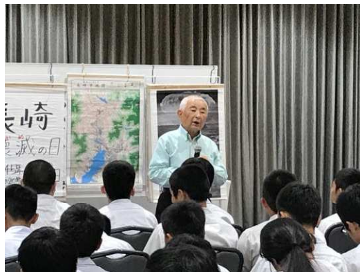
【1日目：被爆体験者による講習】

さて、上述の修学旅行では私も引率をしてきました。1日目は飛行機で出発してバスで移動する行程だったので、ほとんどの時間が移動に費やされましたが、バスの中ではバスガイドさんの話しに楽しく答えるなど、笑い声や拍手が絶えない時間を過ごすことができました。平和記念公園では長崎に落ちた原爆の資料に、そしてホテルの中では被爆体験者の講話にショックを受けた生徒もいたようです。2日目はタクシー研修、太宰府天満宮、九州国立博物館、キャナルシティで研修や散策などをしました。3日目は最も楽しみにしていたグリーンランドで思い切り羽を伸ばしていました。1度も傘を開くことがなく、天気にも恵まれ充実した4日間でした。