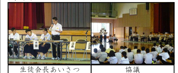
生徒会長あいさつ

5月13日、生徒総会が開催され、30年度の活動報告と会計報告、31年度の活動計画案と会計予算案が承認されました。