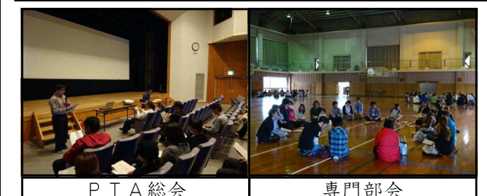
P T A 総会