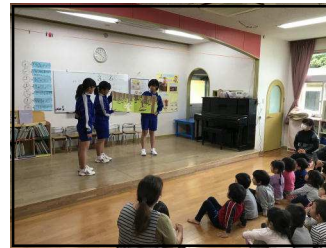
大城こども園さん

3月6～7日、2年福祉体験学習を実施しました。しらゆりの園、さきねん、ひだまり、寿恵苑、町社協、和泊幼稚園、わどまり保育園、国頭・大城・内城各こども園の各事業所の皆様有難うございました。