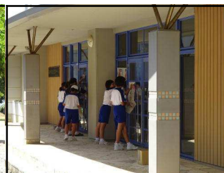
あかね文化ホール