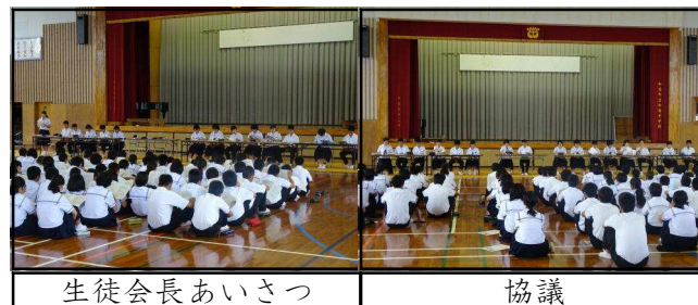
生徒会長あいさつ

5月8日、生徒総会が開催され、28年度の活動報告と会計報告、29年度の活動計画案と会計予算案が承認されました。また、平成8年度から続く「いじめ追放宣言」と平成13年度から続く「交通安全宣言」を宣誓しました。