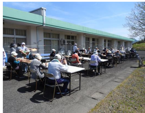
気分転換を兼ねた屋外での食事風景