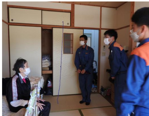
消防総合訓練(居室点検)