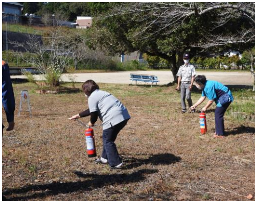
消防総合訓練(東部消防署員立会い)

また、感染状況等に応じて、オンライン面会やガラス越し面会の実施、感染予防や情報等の資料配布を行いました。