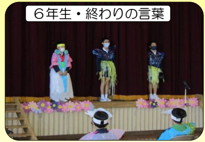
6年生・終わりの言葉