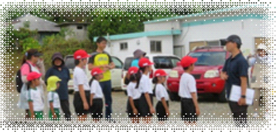
第2校庭から里公民館へ