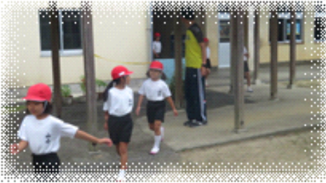
【地震・津波避難訓練】教室から校庭へ