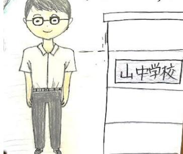
3年生が、1年生のために作成してくれたポスターです。お互いの優しさが表れていて私が好きな作品です。