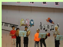
【島口・島唄クラブ】