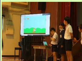
【プログラミングクラブ】

11月11日（土）、多くの保護者や地域の皆様に御来場いただき、学習発表会を開催することができました。子供たちも張り切って舞台上上がり、日頃の学習の成果を発表しました。また、家庭教育学級による読み聞かせなど、学習発表会への様々な御協力に感謝申し上げます。大きな拍手に子供たちがとても嬉しそうでした。ありがとうございました。