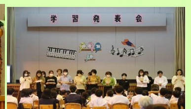
【家庭教育学級（読み聞かせ）】