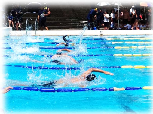
【水泳記録会の様子】

町内の小学5・6年生が一堂に会し、約4年ぶりに長島町水泳記録会が開催されました。町内の小学生が集うのは久しぶりで、先生方も子どもたちも少し緊張している様子がうかがえました。私は当日、開会のあいさつの担当となっていましたので、久しぶりの記録会の開催に寄せて少し話をさせていただきました。私が伝えたかったことは、「他の学校の友達と向き合い競い合うことも大切だが、何よりも大切なことは自分としっかり向き合い、自分の納得がいく泳ぎをする」ということでしたが、記録会では、どの子どもも自分のベストを尽くして泳いでいる姿を見て、うれしく思うことでした。特に、水泳記録会での川床小学校の子どもたちの活躍は素晴らしく、一学期の水泳の学習で培った力を思う存分発揮していました。この水泳記録会での経験が、子どもたちの成長に大きく結び付けてくれることと期待しています。なお、水泳記録会の結果は、現在、事務局で記録を整理しておりますので、2学期の始業式までには、頑張った子どもたちの成果を紹介できると思います。