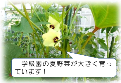
学級園の夏野菜が大きく育っています！

二学期、それぞれのチャレンジを通して、大きく成長した子どもたちと出会えるのを楽しみにしています。