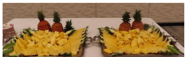
龍潭 RC 会長夫人（幹事）より送られてきたパイナップル