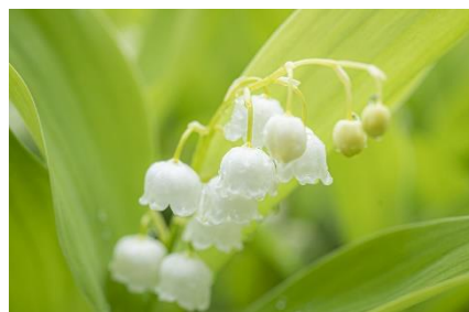
スズラン [幸福の再来、純粹、純潔、謙遜]