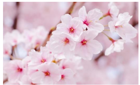
サクラ [精神の美、優美な女性]