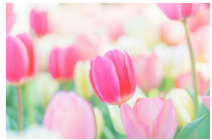
チューリップ [ 博愛、思いやり ]

【観桜会】2024年4月7日(日) 例会 15:30～ 例会終了後バーベキュー 於: 田崎みどりの広場 【グラウンドゴルフ大会】観桜会前に開催 場所: 鹿屋グラウンドゴルフ場 13:00 集合