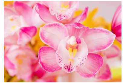
シンビジウム【飾らない心、素朴、壮麗、華やかな恋 高貴な美人、誠実な愛情、深窓の麗人】

◆ 3RC (鹿屋・かのや東・鹿屋西) 合同例会 令和6年2月5日(月)18:30～ ホテルさつき苑 講演: 黒木次男様による永田良吉初代市長講話、懇親会