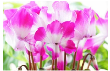
シクラメン [内気、はにかみ、清純、きずな 愛情、思いやり、緻密な判断常]

[年末家族会] 2023年12月18日(月) 18:30～ "みんなで楽しみましょう" [年明け初回例会] 2024年1月15日(月) 18:30～ 全員クラブ協議会&新年会