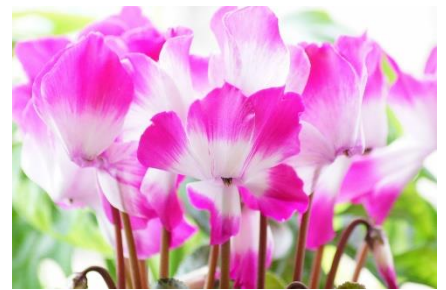
シクラメン [内気、はにかみ、清純、さずな 愛情、思いやり、緻密な判断]

〔龍潭 RC 訪問〕 11月12日(日)～11月15日(水) "楽しい交流を!" 〔年末家族会〕 12月18日(月) 18:30～ "みんなで楽しみましょう"