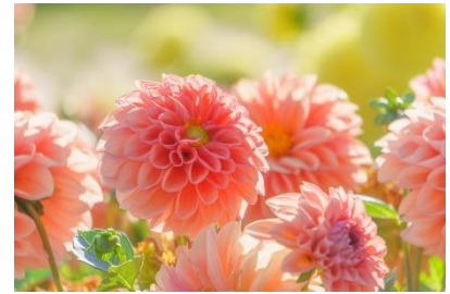
ダリア [ 華麗・優雅・気品・威厳・ 移り気、裏切り、不安定 ]