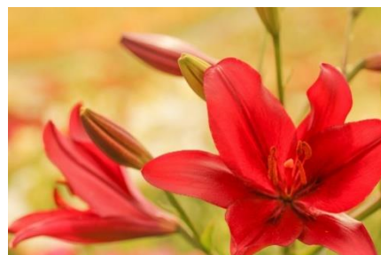
ユリ [純潔・無垢・威厳]