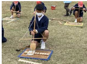
【縄文の森で火おこし体験】