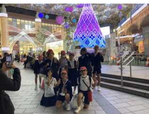
【アミュプラザイルミネーション前】