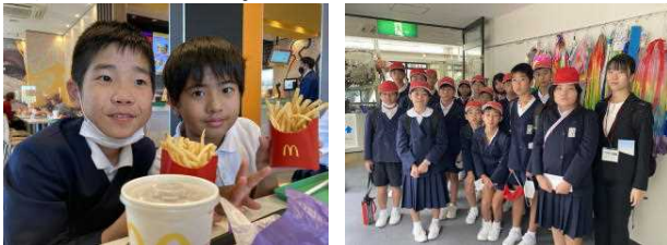
【マクドナルドで昼食】

コロナで延期され、待ちに待っていた修学旅行に行ってきました。子供たちは、時間を守り、ルールやマナーを守り、ホテルの担当者の方や添乗員の方に素晴らしい態度だと褒められていました！教育旅行としての目的を十分に達成した修学旅行となりました。