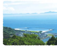
●遠見番山からの眺め

江口漁港に水揚げされた新鮮な魚介類、鮮度をそのままに豊富に展示、即売されています。