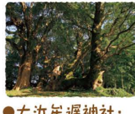
●大迫年遅神社・千本楠