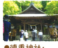
●徳重神社・妙円寺