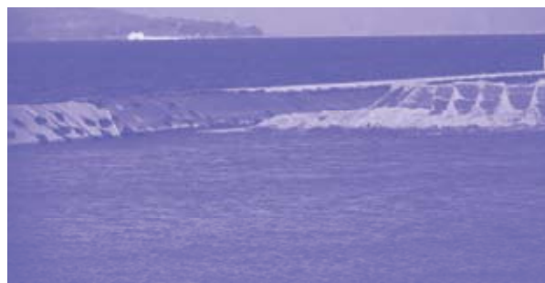
▲3月16日現在の人工島の埋め立て未完了部分