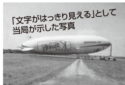
「地上に着陸し動かない飛行船」の写真だった。

（東京タワーの高さ333m） 当局があわてて撮った地上300m上空の飛行船 7月臨時議会で、飛行船を 使つての「PR広告、1千万円」 が突然予算化。（共産党は「問 題あり、もつと他にやるべき」 とがある。」と反対。）