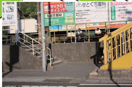
市道と市電停留所までは 1m10cmの段差が。 高齢者も大変、車イスでは市電・ JRの利用できず