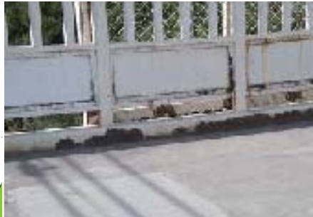
2月下旬までに 塗装・補修を実施