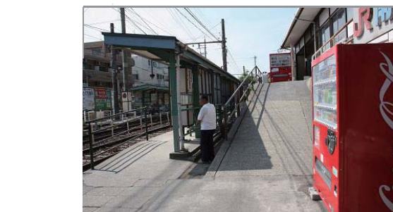
市電線路から、さらに2m60cm急な坂