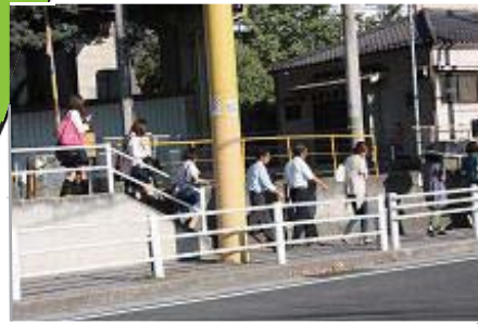
歩道はせまく「急な階段」 で車イス利用は通行できず