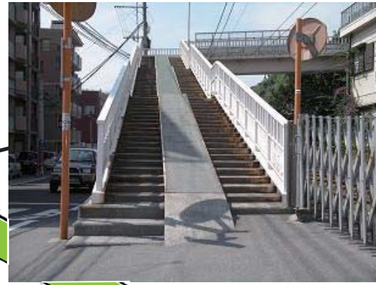
3月上旬までに手すり 設置の緊急対策を実施