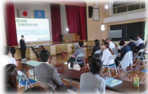
【教育に関する意見交換会より】

今年度も、保護者の皆様との連携を一層図りながら教育活動を充実させていきたと考えていますので、ご協力の程よろしく願いいたします。