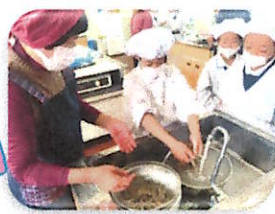
4年 高齢者との交流活動