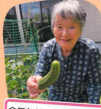
今年もたくさん野菜が採れました。