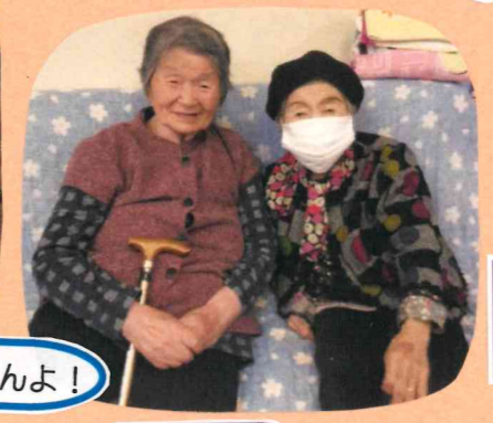
いい天気なので お散歩しました。