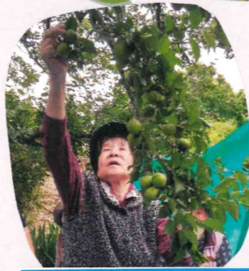
こけもなっちょっど〜!