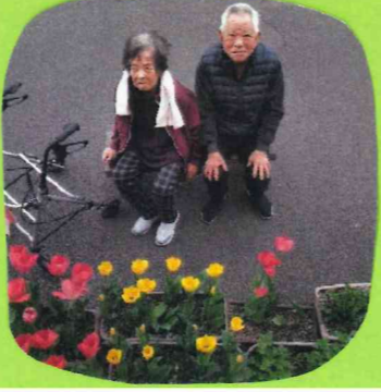
色鮮やかなチューリップが咲きました。 チューリップにも負けない笑顔もたくさん!!