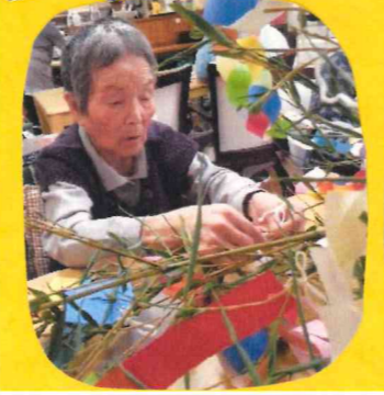
願い事が叶いますように