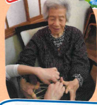
若い人にはまだまだ負けんよ!