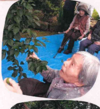
ふっとか梅がなっちょった。