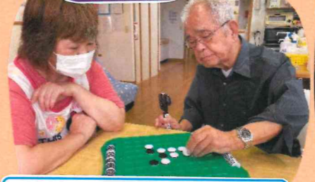
スタッフ全敗(ノド)ツツク...