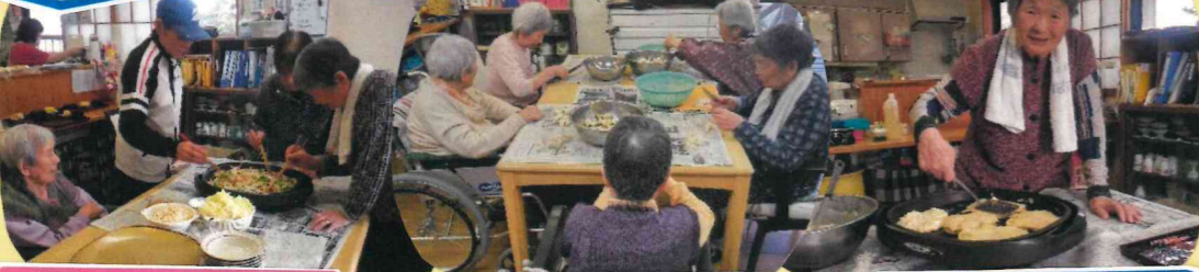
そこをまぜっくいやん。