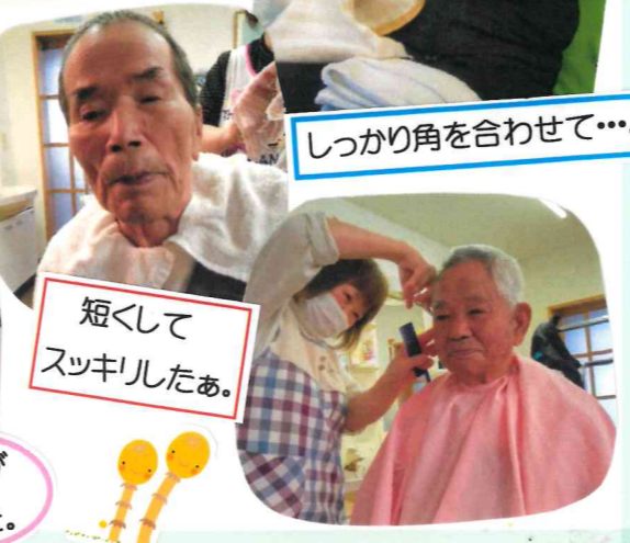
短くして スッキリしたあ。