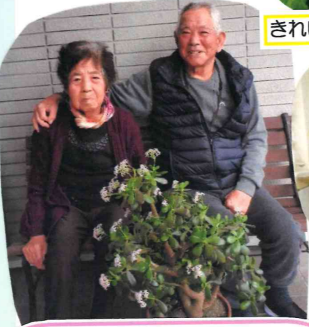
私達が育てた「金の生る木」に花が 咲いたので、皆に見てもらいました。