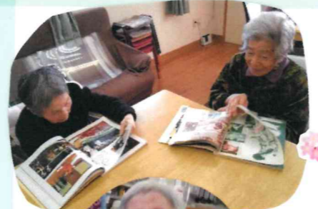
みてみて上手でしょ!!