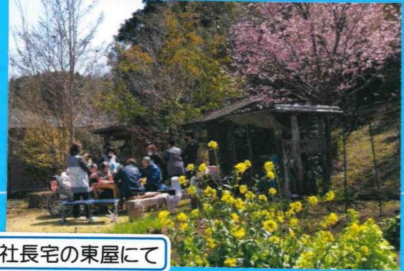
社長宅の東屋にて