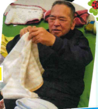
しっかり角を合わせて...