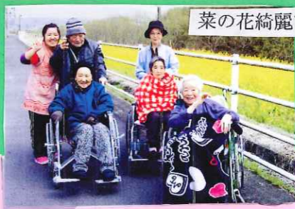
菜の花綺麗でした