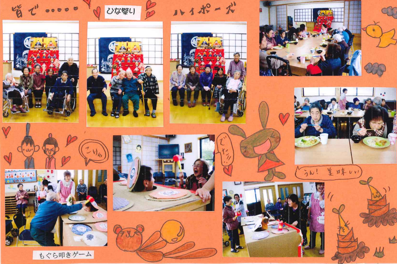
もぐら叩きゲーム