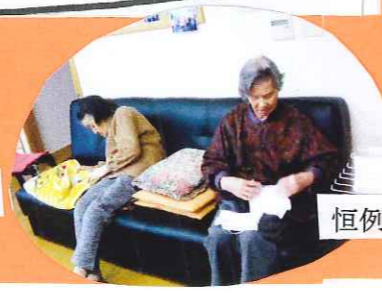
恒例の洗濯たたみ