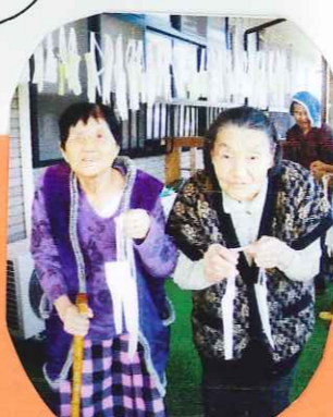
ジャージャーン! 完成!