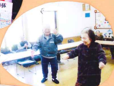
踊りも飛びだしました