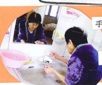
手洗い・うがい・