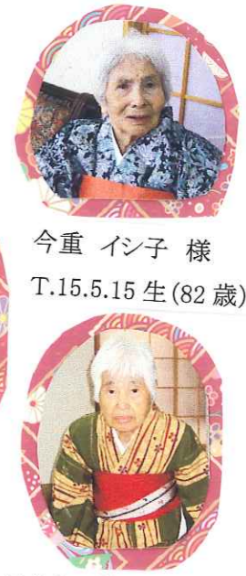
今重 イシ子 様 T.15.5.15 生 (82 歳)