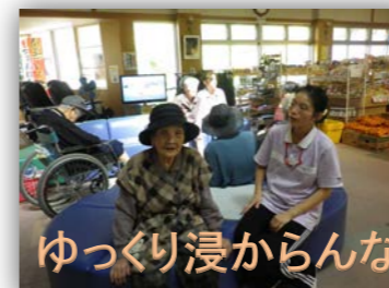
ゆっくり浸からんなら