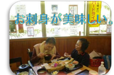
お刺身が美味しい。