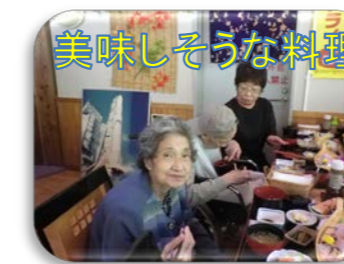
美味しそうな料理