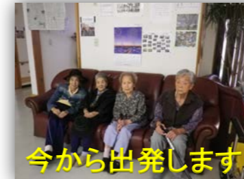
今から出発します。