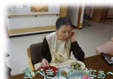
食べきれなかなあ～