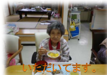
いただいています。