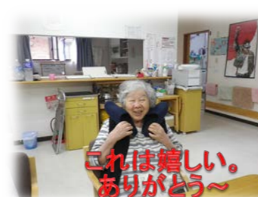
これは嬉しい。ありがとう～