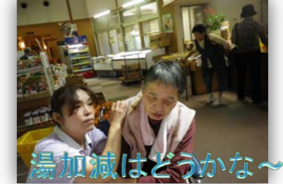
湯加減はどうかな～