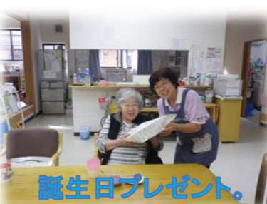
誕生日プレゼント。