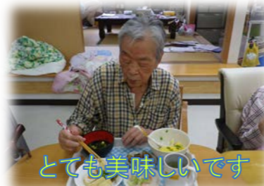
とても美味しいです