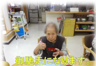
御馳走になります。